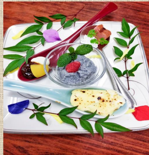
【料理長の出し巻き玉子】 ¥600 (税サ込) ~お土産にいかがでしょうか~